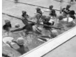
泳ぎが苦手な子の為の水泳教室です。