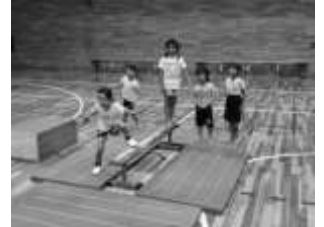
学校では教わらない「体育上達のコツ」を学ぼう!