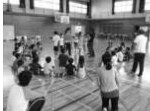
毎回趣向をこらした遊びで思いきり楽しもう!