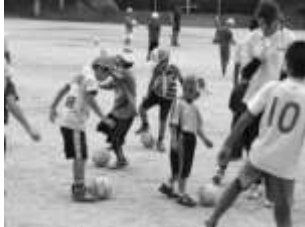
真夏の太陽の下、広いグラウンドを駆け回ろう!